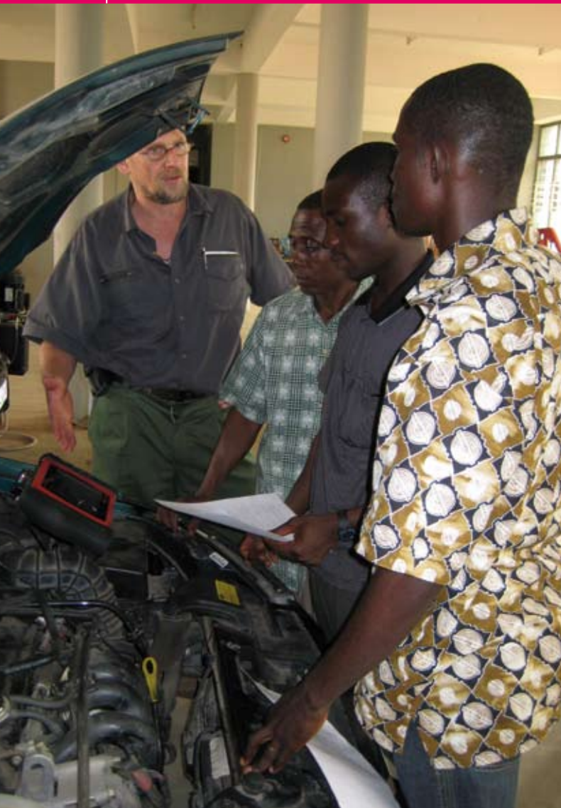
In Zambia is beroepsonderwijs voor weinigen weggelegd.

» ele beroepsopleidingen en bedrijfsleven is een algemeen probleem in Zambia. Afgestudeerden presteren daardoor op de werkvloer onder de maat. De overheid ziet juist deze opleidingen als vitaal voor de nationale economie en dringt aan op vernieuwing van deze zogeheten TEVET-sector (Technical Education Vocation and Entrepreneurship Training). Ze stuurt aan op meer autonomie en zelfmanagement van de opleidingsinstituten. Zambia is een van de landen waarop de Nederlandse ontwikkelingssamenwerking is gericht. NORTEC kon daarom een aanvraag indienen binnen het Netherlands Programme for the Institutional Strengthening of Post-secondary Education and Training Capacity (NPT) van het ministerie van Buitenlandse Zaken, vierjarige projecten waarbij een opleidingsinstituut in een ontwikkelingsland ondersteuning krijgt van Nederlandse experts. NORTEC werkte tussen april 2005 en april 2009 samen met medewerkers van het in middelbaar beroepsonderwijs gespecialiseerde onderzoeks- en adviesbureau Cinop.