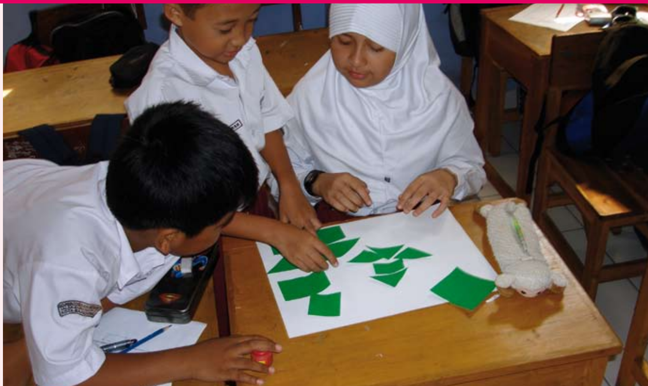
Sommige Indonesische scholen hebben zoveel leerlingen dat ze een ochtend- en een middagshift draaien.