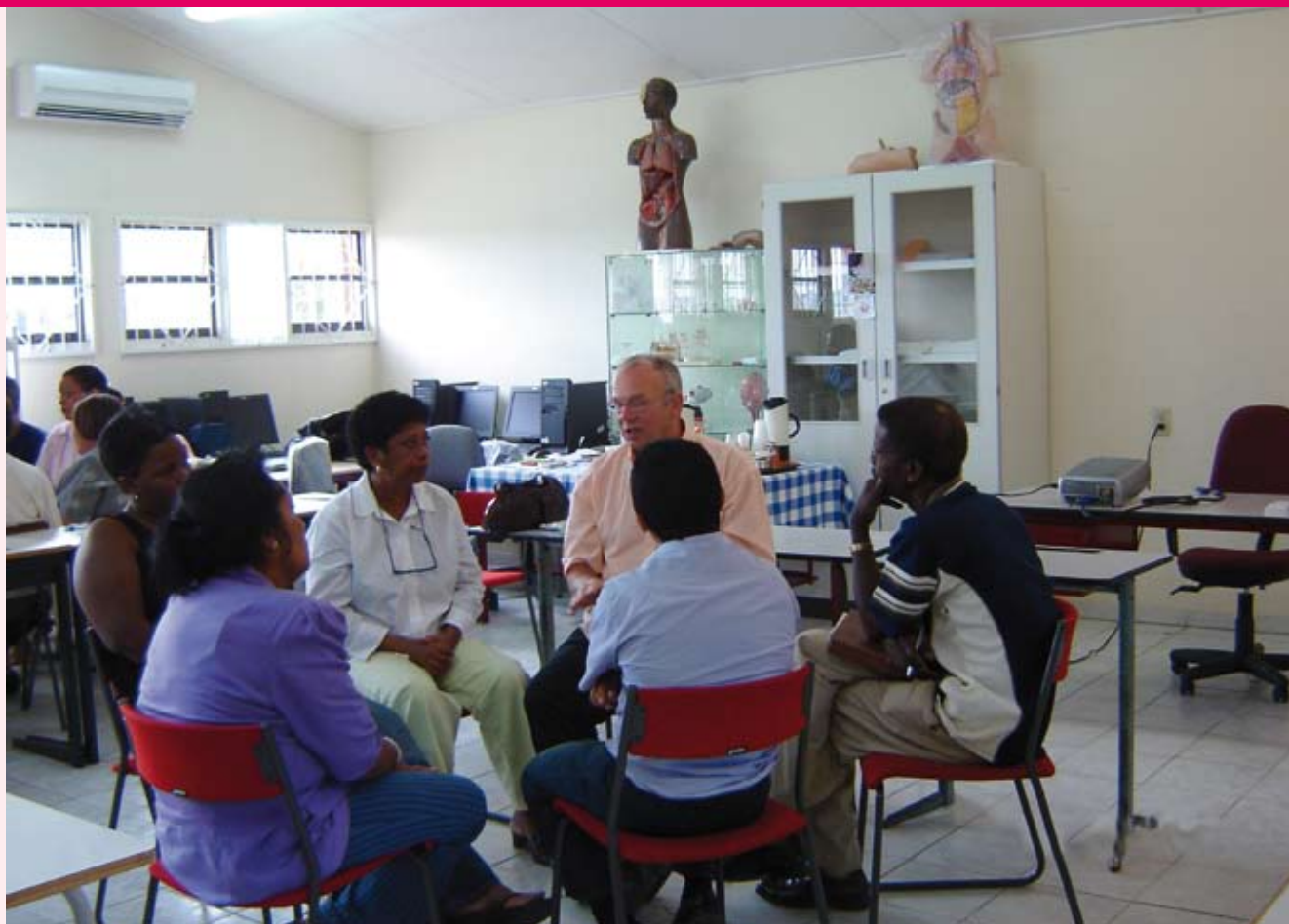
Onderwijsverbetering op de Antillen is een uitdaging.

koloniaal." "Maar wat bedoel je dan?", vroeg ik, "ik probeer toch alleen als projectleider de deadline te handhaven?" Ik heb dat soort opmerkingen inmiddels leren herkennen als een manier om onmacht te tonen. Mensen zeggen eigenlijk: "ik voel me gepiepeld". Maar de situatie is veranderd: we zijn geen kolonisator. We moeten in dialoog een andere attitude zoeken. Dat kost tijd. Dit soort dingen doorzie je niet in twee à drie weken, dat kost twee à drie jaar. En dat speelt externe adviseurs en trainers wel degelijk parten. We redden het alleen als we kunnen samenwerken met lokale mensen. Maar die zijn dun gezaaid.'