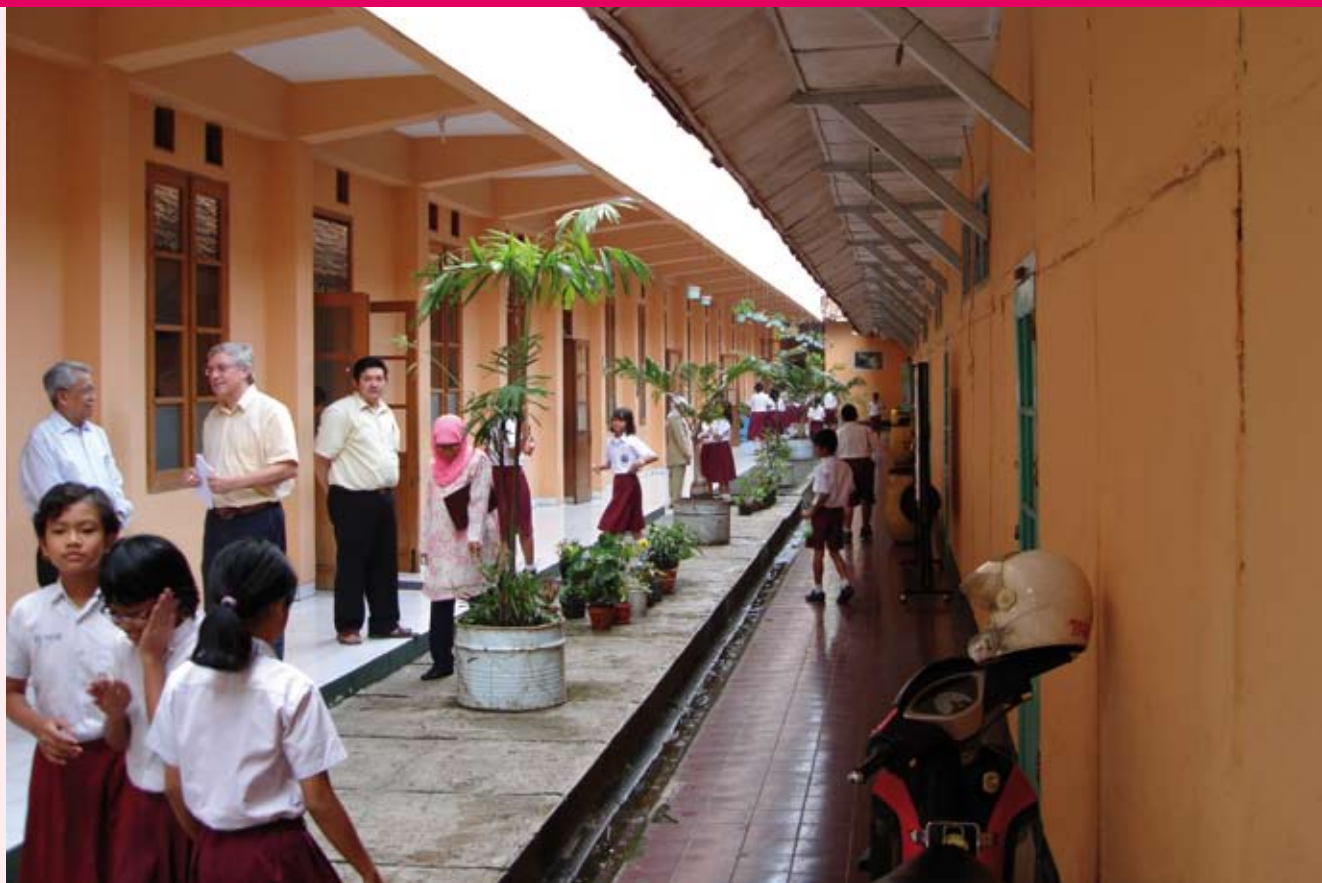
Het succes van projecten hangt sterk samen met de kwaliteit van het bestuur in de partnerlanden.