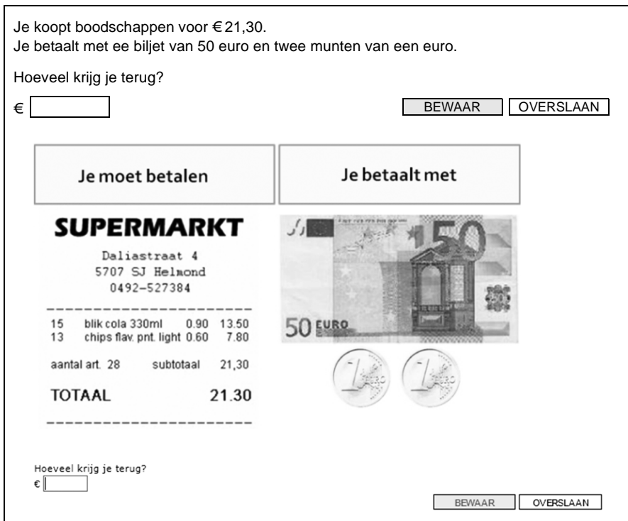
figuur 2: twee varianten van één opgave

venkenmerk op de prestaties van de leerling. In dit onderzoek wordt gewerkt met twee varianten van opgaven. Een variant waarbij de context vooral gepresenteerd door middel van een talige omschrijving en een variant waarbij de context vooral wordt gepresenteerd door middel van beeld. In figuur 2 staat een voorbeeld.